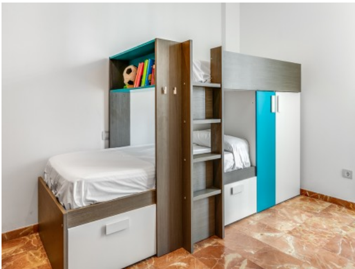
Das dritte Schlafzimmer mit Hochbett