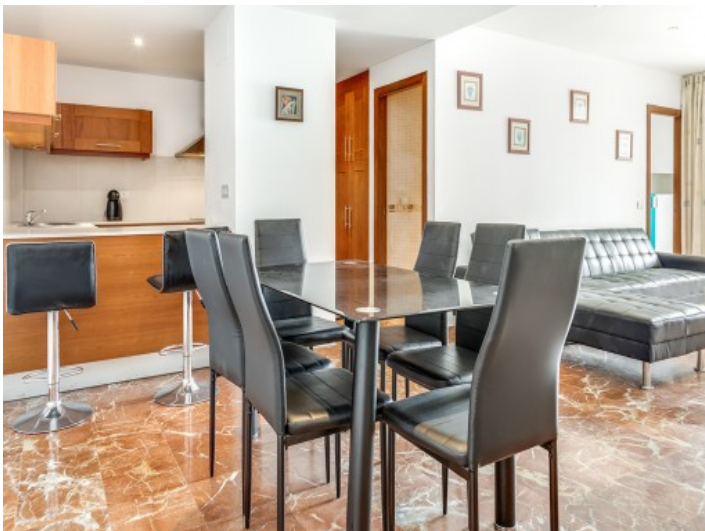
Freundlicher Essbereich mit offener Küche