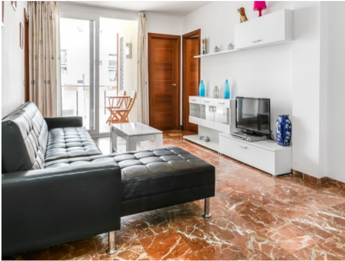
Heller Wohnbereich mit Terrassenzugang