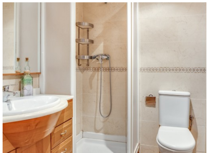
Badezimmer en Suite mit Dusche

Alle Angaben nach bestem Wissen. Irrtum und Zwischenverkauf vorbehalten. Dieses Exposé ist eine Vorinformation, als Rechtsgrundlage gilt allein der notariell abgeschlossene Kaufvertrag.