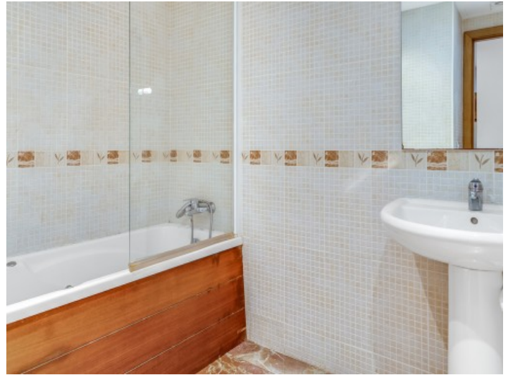
Das zweite Badezimmer mit Badewanne