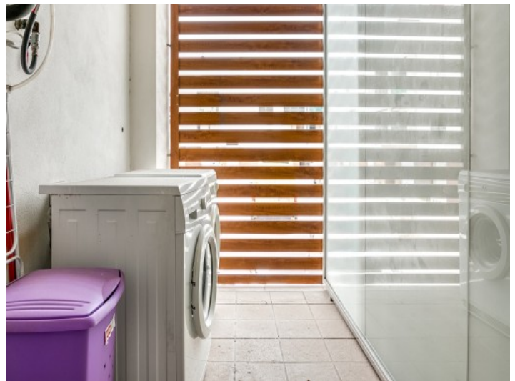
Abstell- oder Waschraum