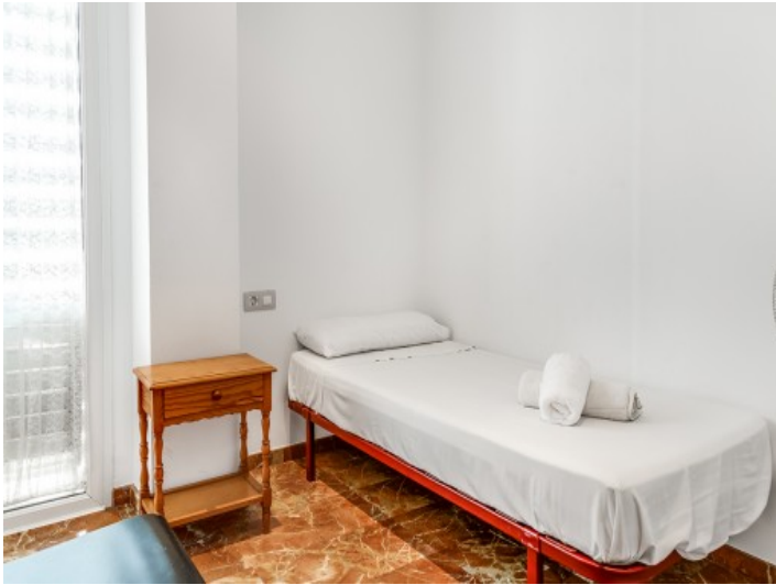
Eines von 3 Schlafzimmer