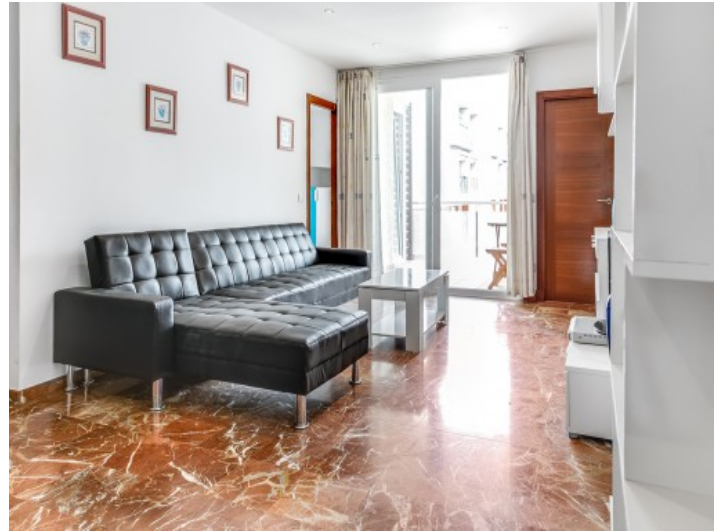
Alternative Ansicht des großzügigen Wohnbereiches