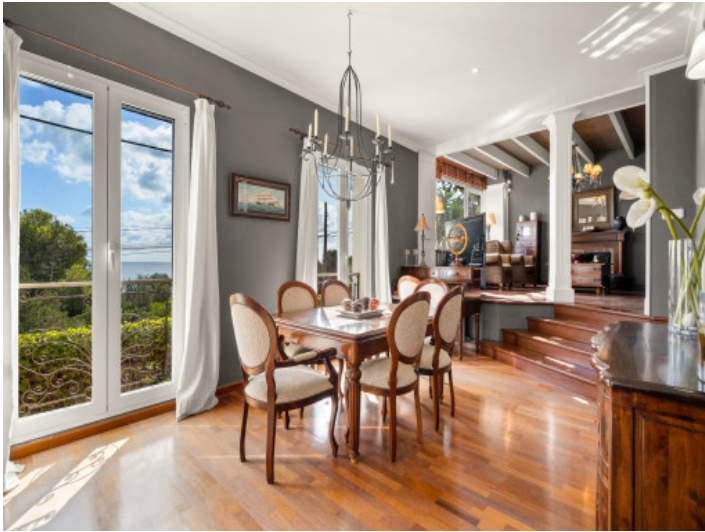
Schicker Essbereich mit Meerblick