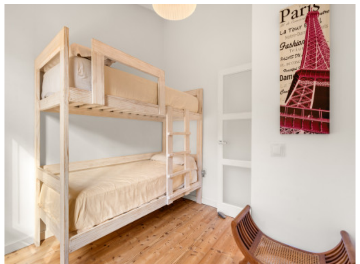
Eines von insgesamt 7 Schlafzimmern

Alle Angaben nach bestem Wissen. Irrtum und Zwischenverkauf vorbehalten. Dieses Exposé ist eine Vorinformation, als Rechtsgrundlage gilt allein der notariell abgeschlossene Kaufvertrag.