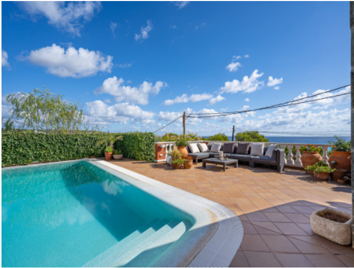
Poolbereich in atemberaubender Lage