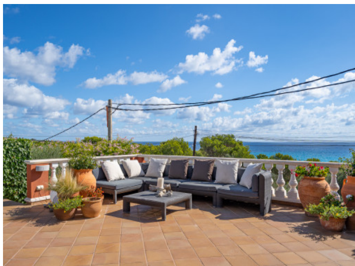
Sonnenterrasse mit Meerblick