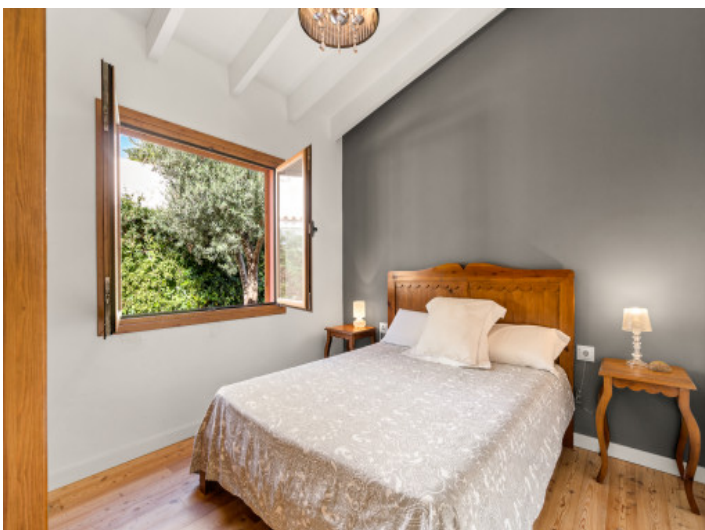
Eines von insgesamt 7 Schlafzimmern