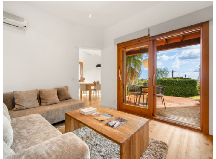
Modernes Wohnzimmer mit Terrasse