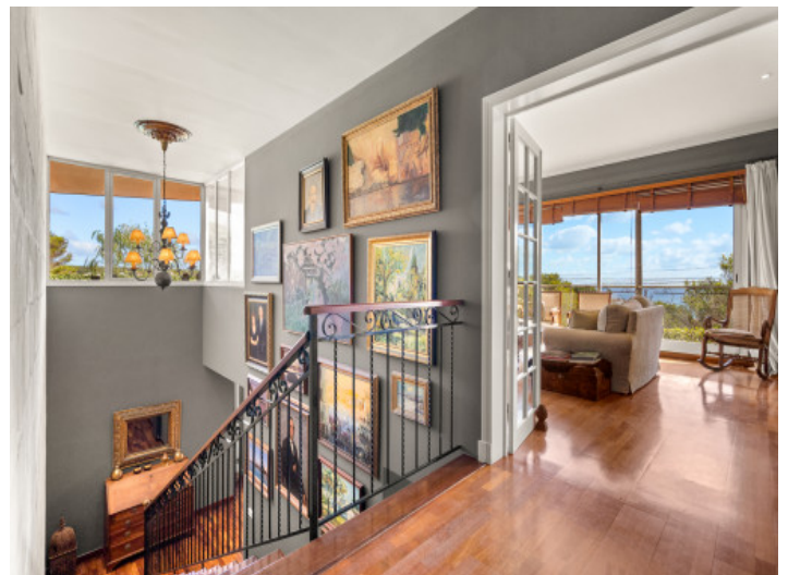
Elegante Treppe nach oben

Alle Angaben nach bestem Wissen. Irrtum und Zwischenverkauf vorbehalten. Dieses Exposé ist eine Vorinformation, als Rechtsgrundlage gilt allein der notariell abgeschlossene Kaufvertrag.