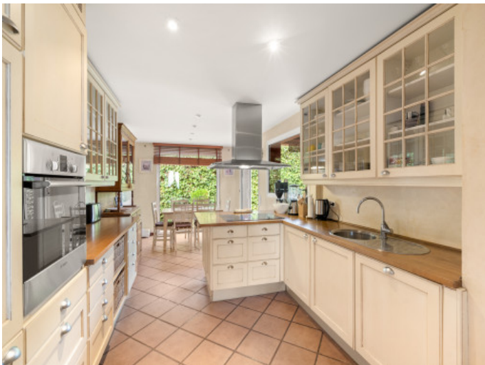
Komplett ausgestattete Küche mit Frühstücksbereich