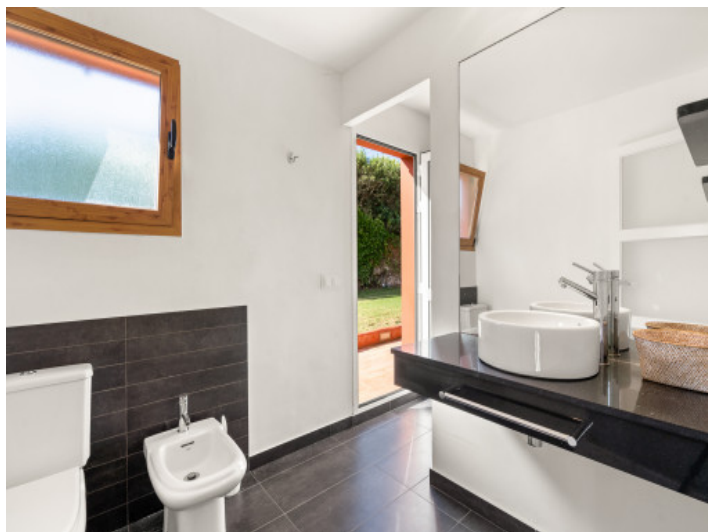
Modernes Badezimmer mit Gartenzugang