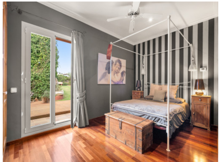
Doppelschlafzimmer mit Gartenzugang