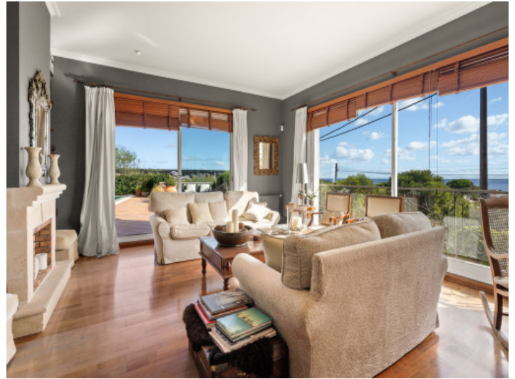
Lichtdurchfluteter Wohnbereich mit Meerblick