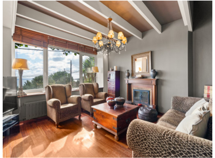
Angrenzender Wohnbereich mit Kamin