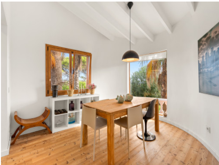
Schön renovierter Essbereich