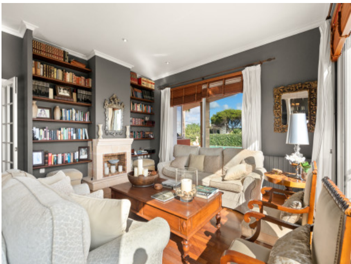
Wunderschönes Wohnzimmer mit Kamin