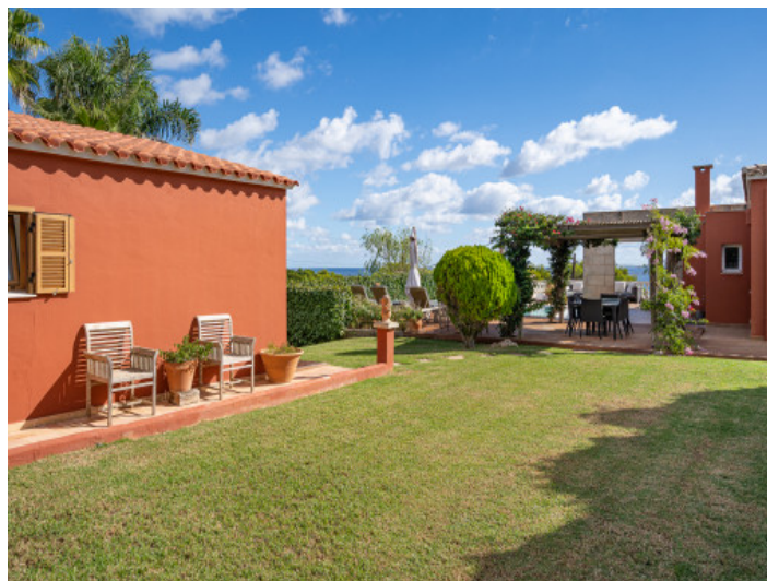
Sehr gepflegter Garten