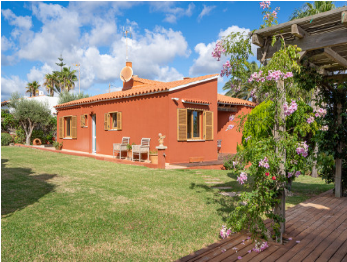
Blick zum zweiten Haus