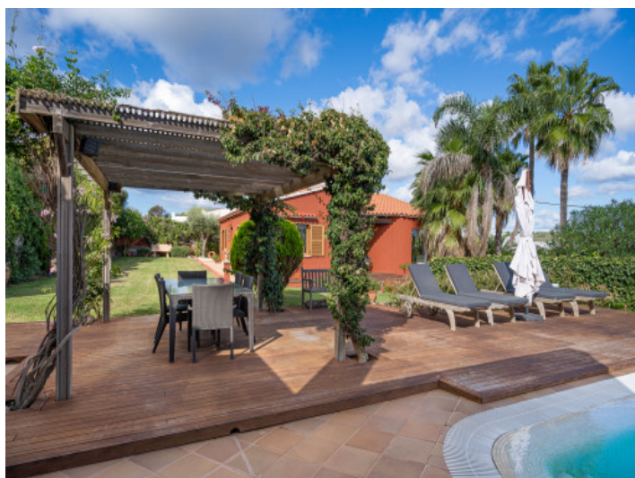
Essbereich im Freien