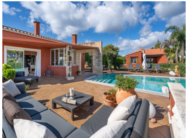
Entspannter Loungebereich am Pool