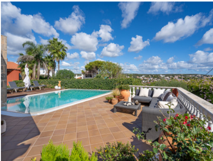
Herrlicher Ausblick von der Poolterrasse