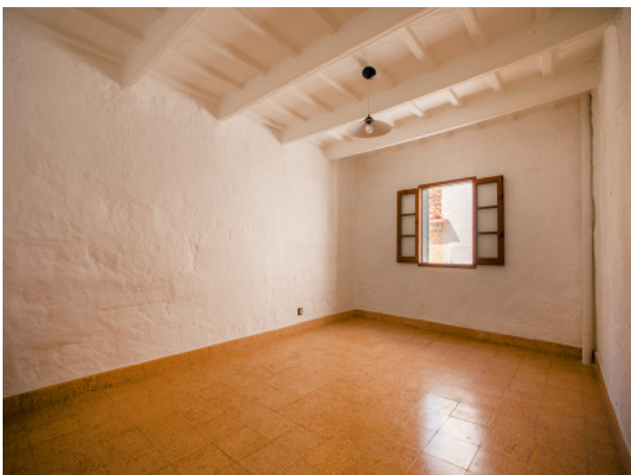
Eines der 6 Zimmer