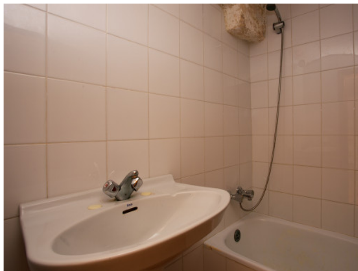
Badezimmer mit Badewanne