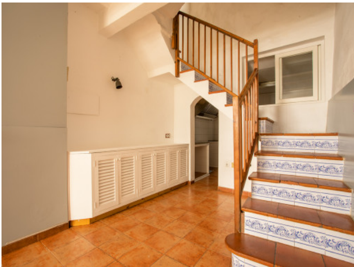
Offener Wohn- und Eingangsbereich