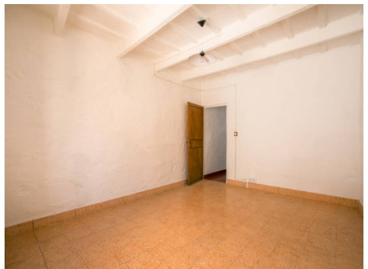
Eines der 6 Zimmer

Alle Angaben nach bestem Wissen. Irrtum und Zwischenverkauf vorbehalten. Dieses Exposé ist eine Vorinformation, als Rechtsgrundlage gilt allein der notariell abgeschlossene Kaufvertrag.