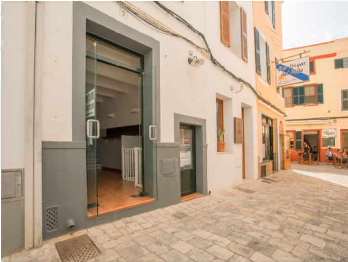
Außenansicht des Hauses