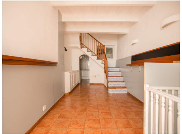
Offener Wohn- und Eingangsbereich