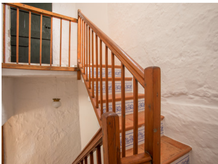
Ansicht des Flurbereichs