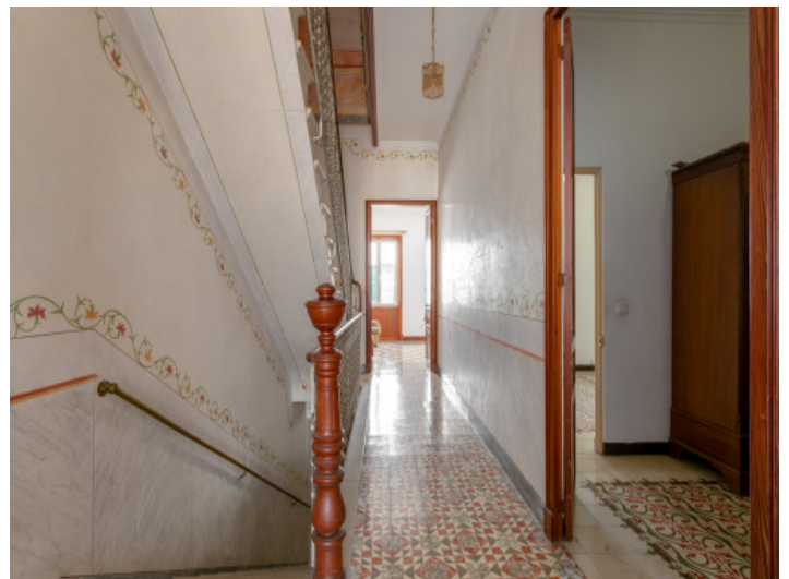
Treppenaufgang des Hauses

Alle Angaben nach bestem Wissen. Irrtum und Zwischenverkauf vorbehalten. Dieses Exposé ist eine Vorinformation, als Rechtsgrundlage gilt allein der notariell abgeschlossene Kaufvertrag.