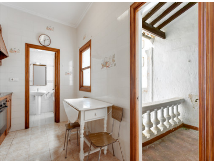
Zugang von der Küche zum Balkon