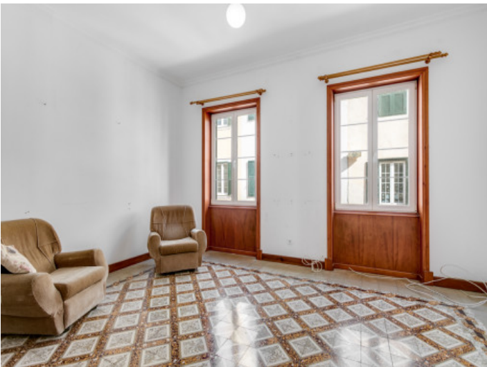
Alternative Ansicht des Wohnbereichs