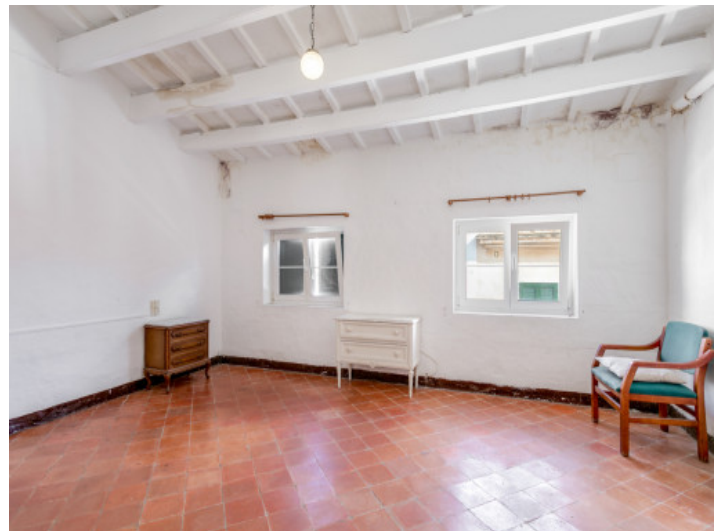
Wohnbereich im oberen Stockwerk