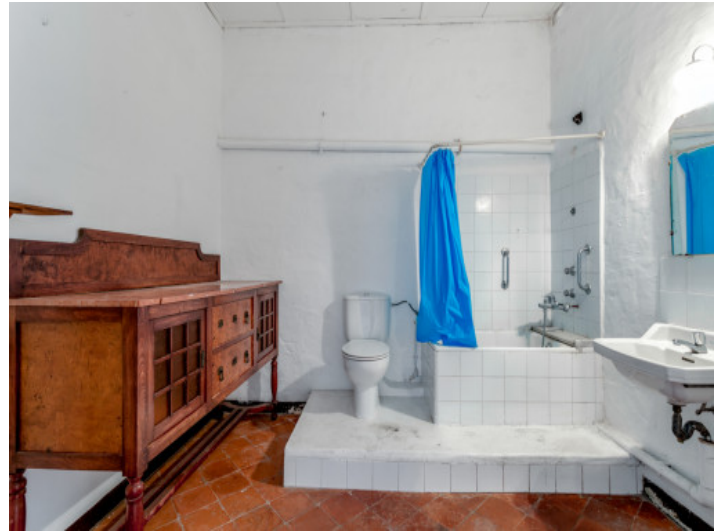
Großes Badezimmer des Hauses