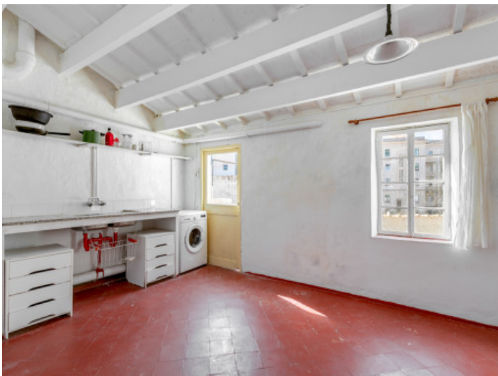
Küche im Obergeschoss