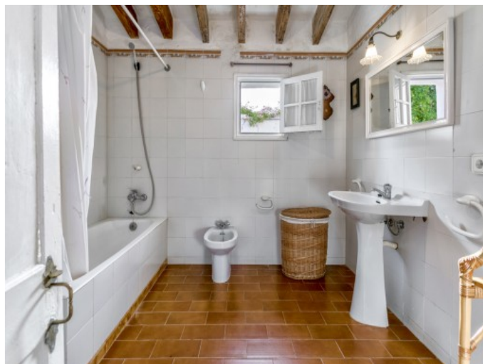
Badezimmer mit Tageslicht