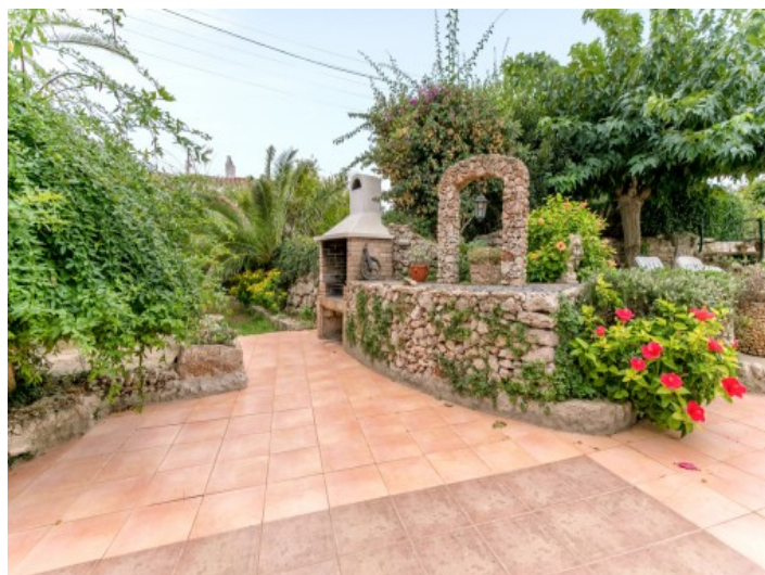
Gut gepflegter Garten

Alle Angaben nach bestem Wissen. Irrtum und Zwischenverkauf vorbehalten. Dieses Exposé ist eine Vorinformation, als Rechtsgrundlage gilt allein der notariell abgeschlossene Kaufvertrag.