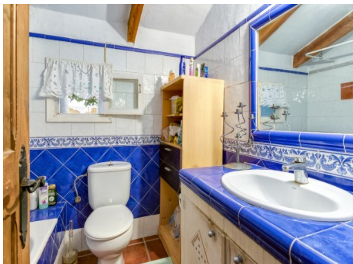
Badezimmer des Gästehauses