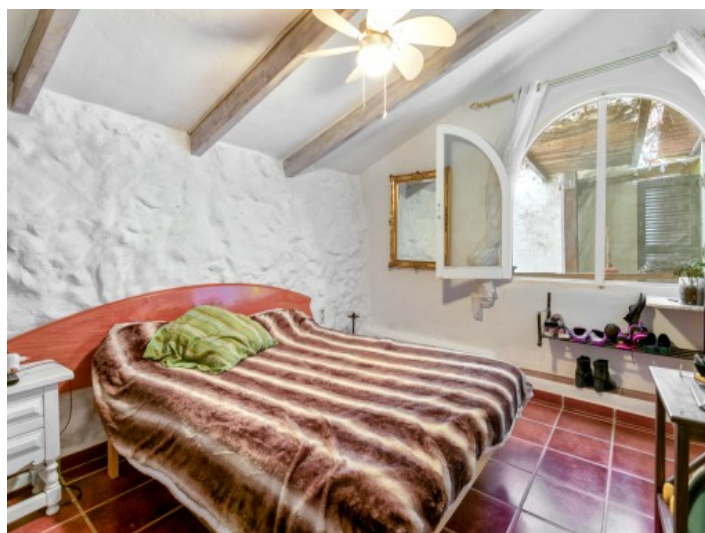
Schlafzimmer des Gästehauses