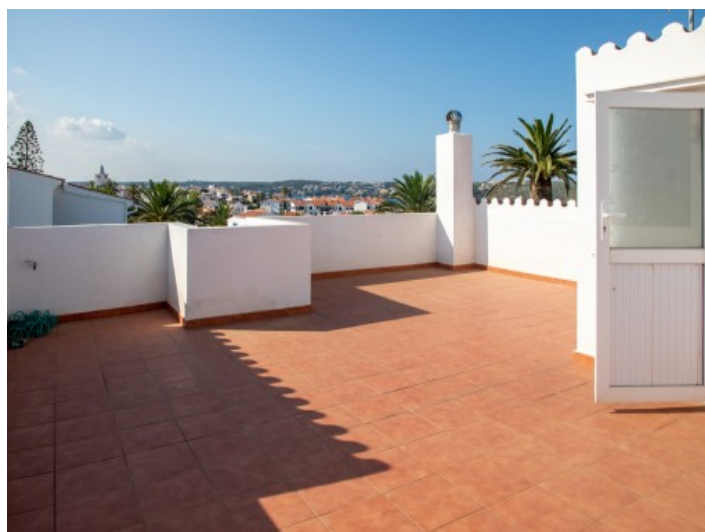
Sonnige Dachterrasse des Hauses