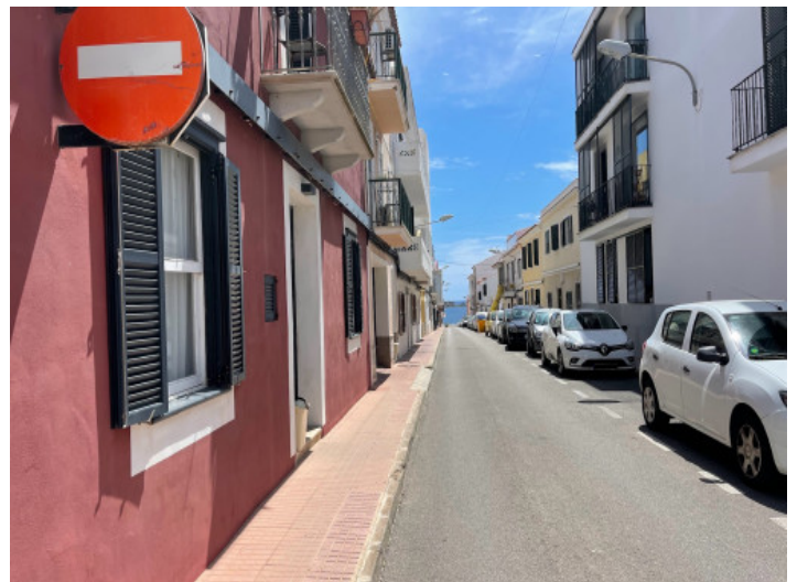
Terreno 3 vistas mar desde calle

Alle Angaben nach bestem Wissen. Irrtum und Zwischenverkauf vorbehalten. Dieses Exposé ist eine Vorinformation, als Rechtsgrundlage gilt allein der notariell abgeschlossene Kaufvertrag.