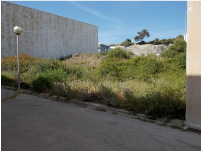
Ansicht des Grundstücks