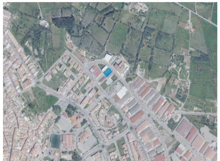
Location of the plot

Alle Angaben nach bestem Wissen. Irrtum und Zwischenverkauf vorbehalten. Dieses Exposé ist eine Vorinformation, als Rechtsgrundlage gilt allein der notariell abgeschlossene Kaufvertrag.