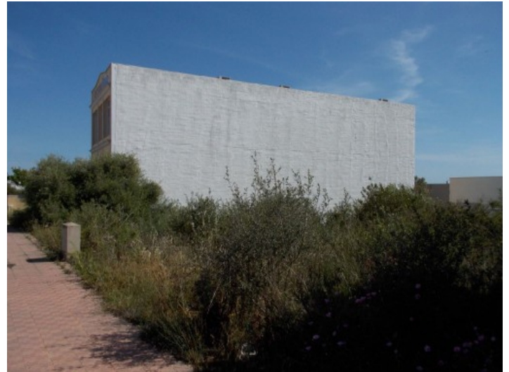
Alternative Ansicht des Grundstücks