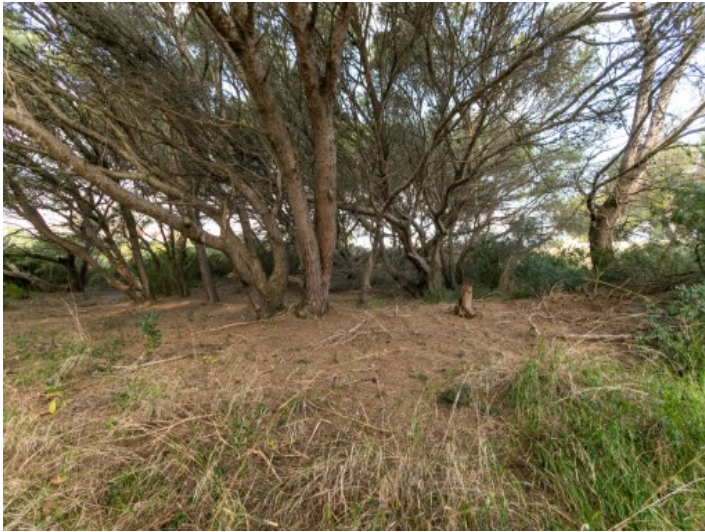
Ansicht des Grundstückes