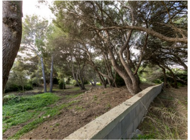
Ansicht des Grundstückes