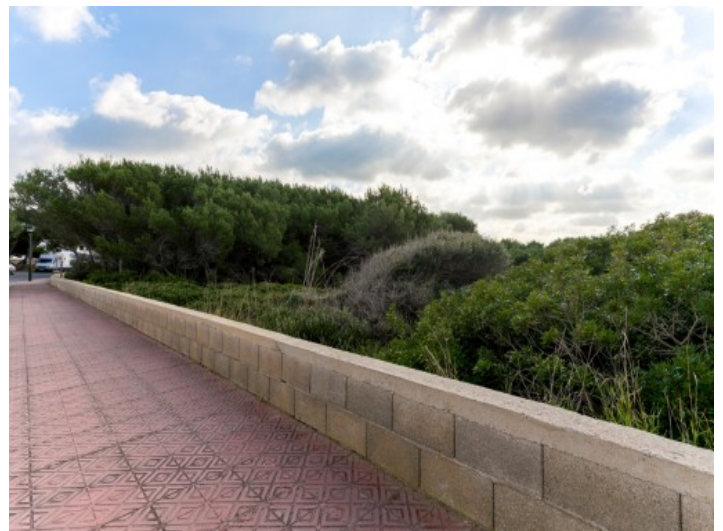
Ansicht des Grundstückes

Alle Angaben nach bestem Wissen. Irrtum und Zwischenverkauf vorbehalten. Dieses Exposé ist eine Vorinformation, als Rechtsgrundlage gilt allein der notariell abgeschlossene Kaufvertrag.