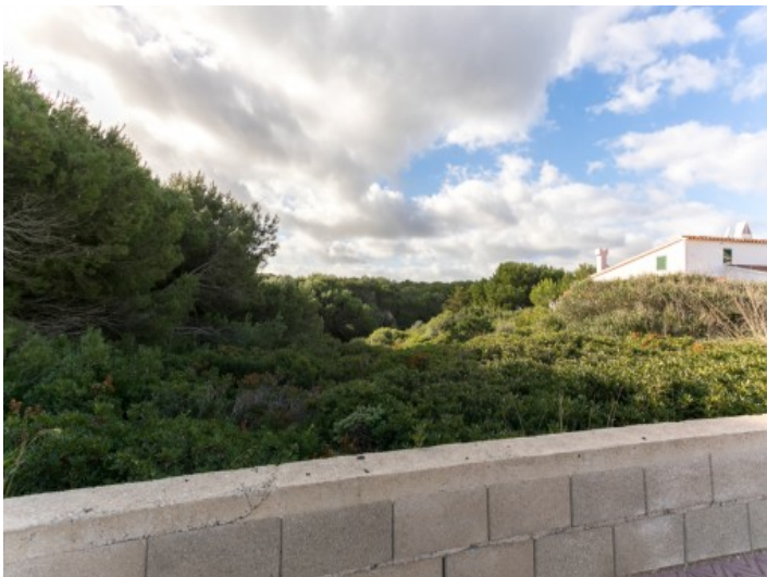
Ansicht des Grundstückes