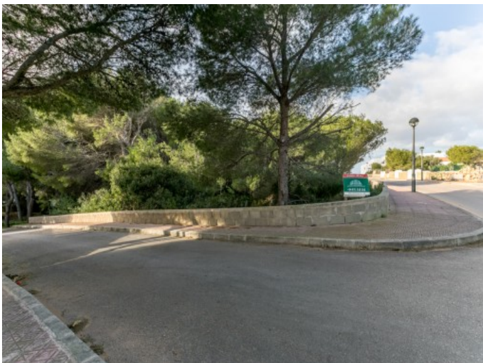
Ansicht des Grundstückes