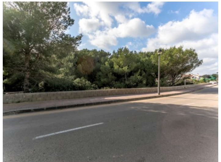
Ansicht des Grundstückes