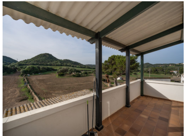
Obere Terrasse mit Weitblick