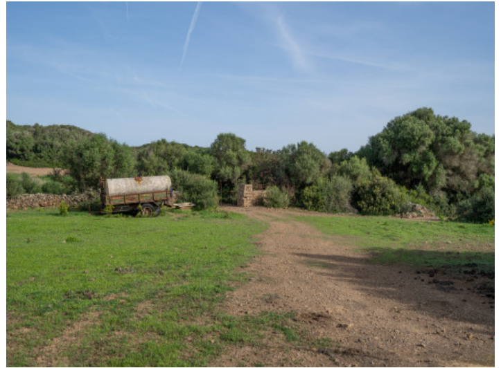
Blick über das Anwesen