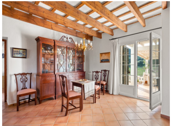
Zugang zur überdachten Terrasse