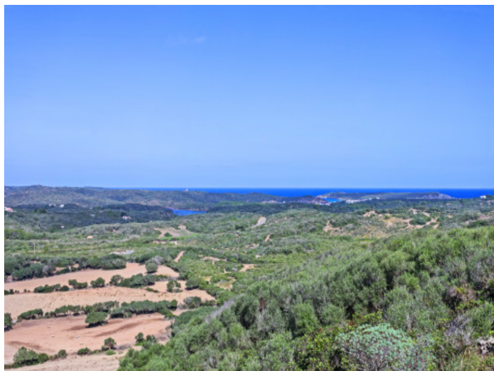
Panoramablick aufs Meer