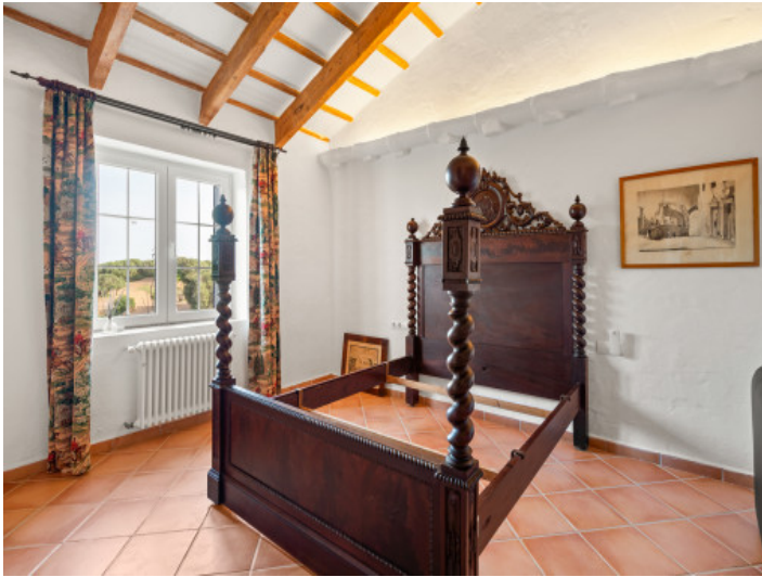
Eines von 6 Schlafzimmern