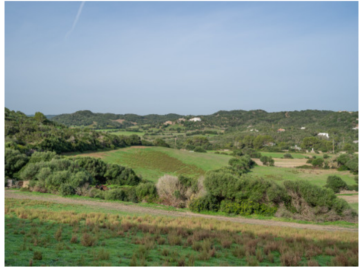
Großes 44ha großes Land