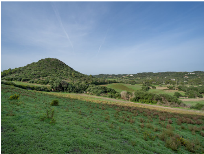
Blick über das Grundstück und die Landschaft