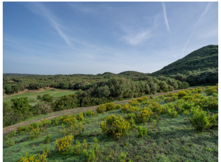
Blick über das Grundstück und die Landschaft