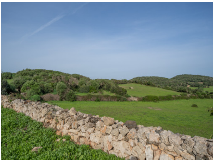
Blick über das Grundstück und die Landschaft