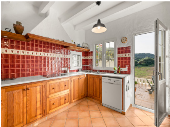
Landhausküche mit Terrassenzugang