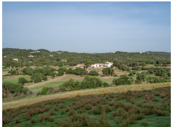
Blick zur Finca

Alle Angaben nach bestem Wissen. Irrtum und Zwischenverkauf vorbehalten. Dieses Exposé ist eine Vorinformation, als Rechtsgrundlage gilt allein der notariell abgeschlossene Kaufvertrag.