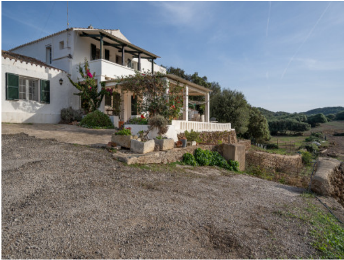
Äußenansicht der Finca