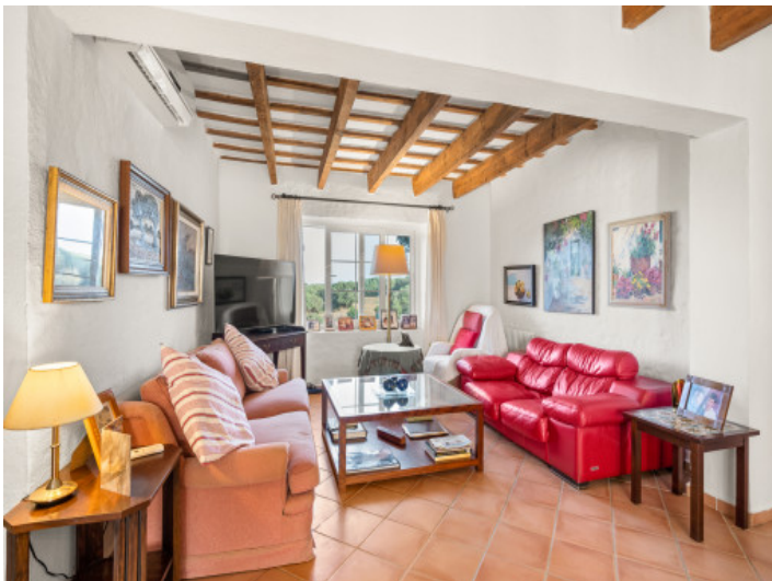
Gemutlicher Wohnbereich mit Holzbalkendecke