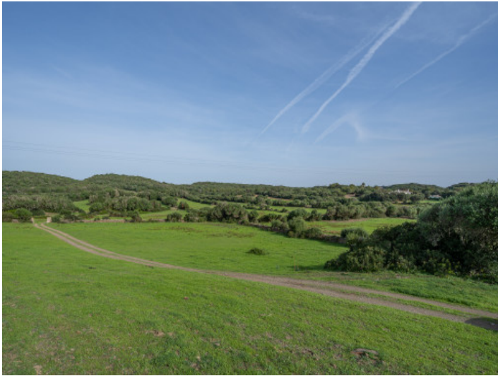
Zufahrt zur Finca