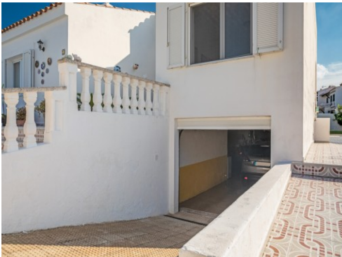
Zufahrt zur geräumigen Garage