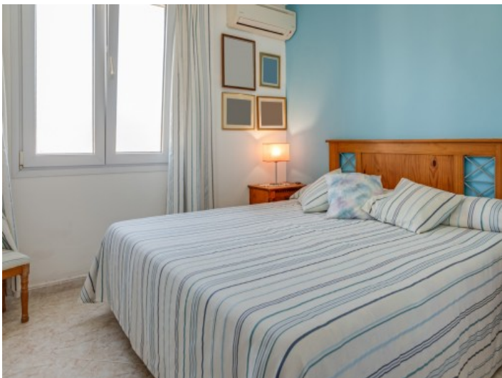
Eines von 4 schönen Schlafzimmern