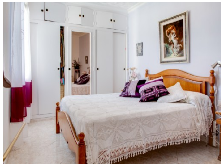
Zweites Schlafzimmer mit Badezimmer en Suite

Alle Angaben nach bestem Wissen. Irrtum und Zwischenverkauf vorbehalten. Dieses Exposé ist eine Vorinformation, als Rechtsgrundlage gilt allein der notariell abgeschlossene Kaufvertrag.