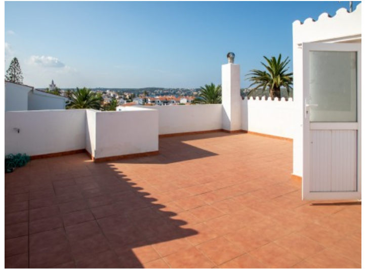
Sonnige Dachterrasse des Hauses