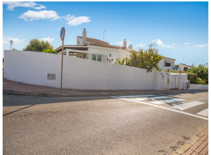
Außenansicht der Villa

Alle Angaben nach bestem Wissen. Irrtum und Zwischenverkauf vorbehalten. Dieses Exposé ist eine Vorinformation, als Rechtsgrundlage gilt allein der notariell abgeschlossene Kaufvertrag.